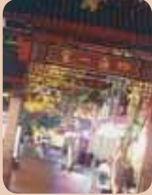
照片：雪梨市都市計畫

華人移民雪梨已接近二百年。早期的華裔雪梨人多數是菜農和商人，也因此有市場之處必有華人。1909至1915年間，市議會於達令港港口處建造一座綜合市場，華裔商人與進口商於是向市議會租下空地與商店，打造各式店面與餐廳，其中以德信街尤為繁榮，成為華埠中心。商店上之樓層，往往是華裔商人的住家，有些無法返回中國家鄉的退休菜農也會定居於此。二十世紀中期，本區開始沒落，除了華人遞減，商場也搬離市區。直到1980年代，華埠才有機會進行重整。隨著雪梨市華人再次增加，華埠不僅成為深受歡迎的旅遊區，同時也是雪梨華人聚會之處。