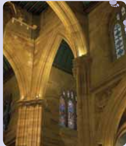
照片：Gary Deirmendjian 作品，雪梨市議會檔案資料

教堂由Edmond Blacket設計，是雪梨市的英國聖公會大教堂，突顯本地與舊歐洲深厚的關係。值得注意的是，教堂背對馬路，其大門與主尖塔則面對雪梨市政廳廣場(Sydney Square)。事實上，此處本應有另一條街道，只是在1860年代大教堂完工之前，街道便已消失無形。有關在此地興建大教堂與大廣場的規劃，可追溯至十九世紀初期，遺憾的是此地在當時離市中心過於遙遠，以致擱置了此計畫。加上北邊有廢棄的舊墓地，附近還有磚廠與市場，讓此地在十九世紀仍相當孤立，直到後期才加以開發。